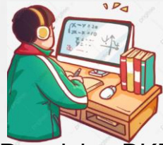
Pengisian BKD Online