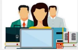
Pengisian LKD Online