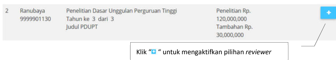
Gambar 3. Mengaktifkan pilihan reviewer